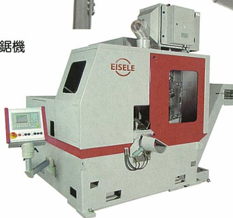
▲HCS 180 (MF) 型 全自動定寸帶鋸機 (碳化鎢圓鋸片) 最大機型工作物規格：棒材 40 mm \phi ~180 mm \phi 型材：40 × 40 / 150 × 150 mm