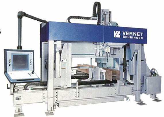
▲HD 1215 型 鋼構型材 鑽孔/攻牙/畫記/擴孔 覆合加工機 最大機型工作物規格：寬 1200 × 高 405 mm