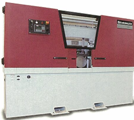
▲HBE 633 A 型 自動定寸帶鋸機 (單一機台可適用鋼材/合金鋼/鋁材鋸切) 最大工作物規格：棒材 660 mm \phi 型材：710 × 660 mm