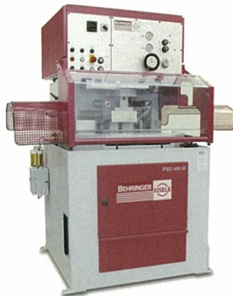
▲PSU 450 H 型 (-30°~90°~+30° 間任一斜角) 型材/棒材/管材 半自動圓鋸機 (HSS圓鋸片) 最大工作物規格：棒材/圓管：140 mm \phi 型材：240 × 70 / 390 × 30 mm